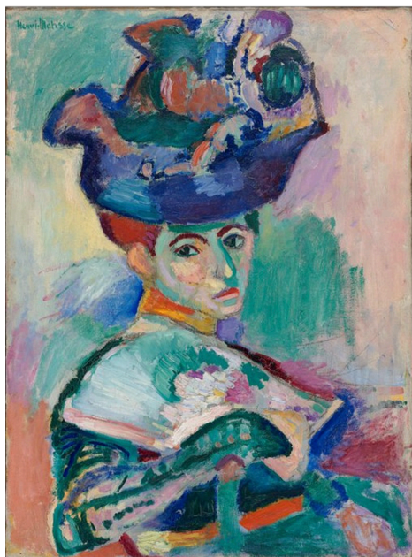
《戴帽的女人》，創作於 1905 年，現藏於舊金山現代藝術博物館。