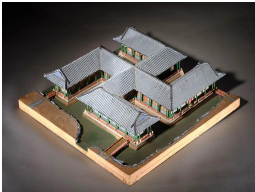
圓明園萬方安和殿燙樣

燙樣，是清代建築設計過程中，依據圖紙、按照比例，使用木板、紙張等材料所製作的模型。由於其製作過程中涉及到使用烙鐵熨燙的工藝，故名燙樣。