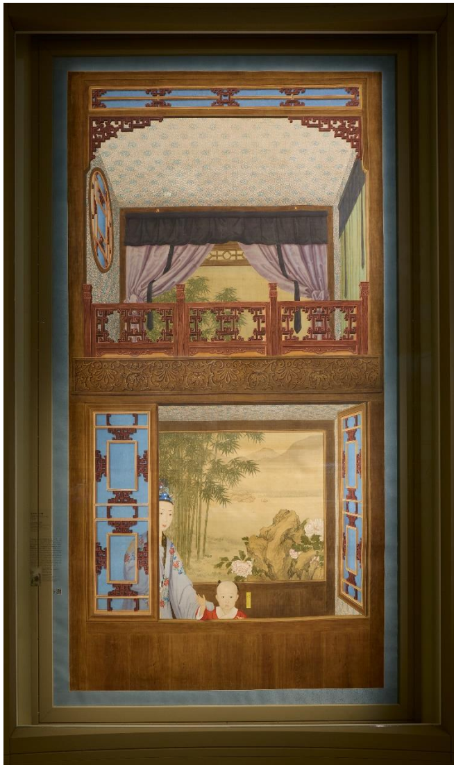
乾隆帝妃及永琰像